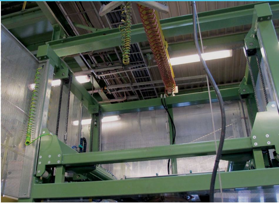
Hydraulische BIG-BAG Presse BIG-BAG hydraulic press